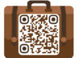
คู่มือการเข้าใช้ระบบ Online Course

• จัดทำ Online Course และอบรมให้กับนักศึกษาสาขาวิชาธุรกิจโรงแรม ชั้นปีที่ 1 และ 2 ในรายวิชาการบริการอาหารและเครื่องดื่ม วิชาการควบคุมต้นทุนอาหารและเครื่องดื่ม วิชาการจัดการห้องอาหาร วิชาการแม่บ้าน วิชาการส่วนหน้า และวิชาสุนทรียภาพในพื้นที่โรงแรม ของโรงเรียนการท่องเที่ยวและการบริการ จำนวน 89 คน